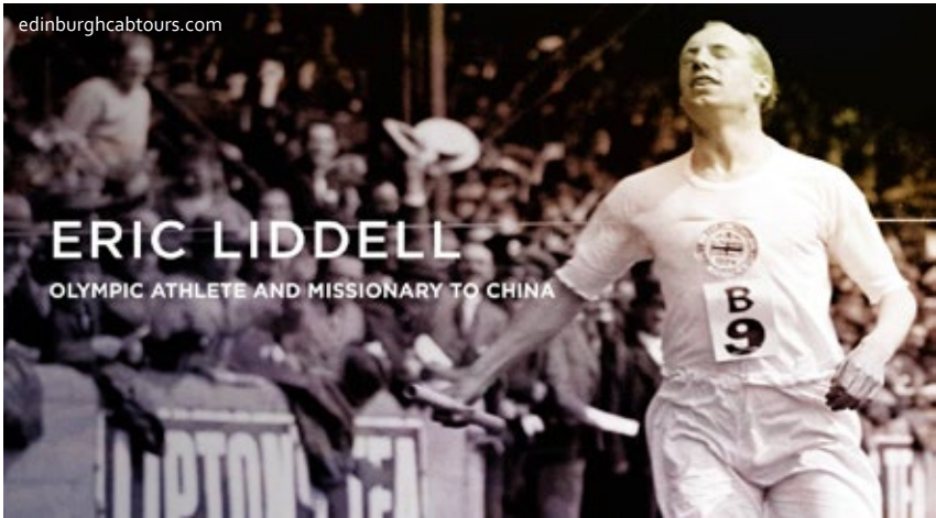
ERIC LIDDELL OLYMPIC ATHLETE AND MISSIONARY TO CHINA

masa sulit ini tanpa langsung memaksakan pilihan 'aman' atau yang mereka anggap 'lebih baik.' Seperti dalam konsep yang diusulkan Keller, setiap proses ini memiliki nilai rohani, dan orang tua bisa mendorong anak untuk tetap setia dan bertumbuh dalam setiap tantangan yang mereka hadapi.